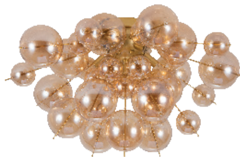
1 Артикул: A8313PL-5GO Ø60 | 133 5x40W | G9