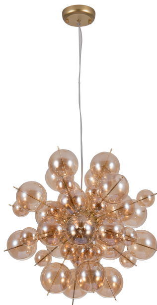
1 Артикул: A8313SP-6GO Ø52 | 152 40W | G9