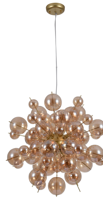
2 Артикул: A8313SP-9GO Ø60 | 160 40W | G9